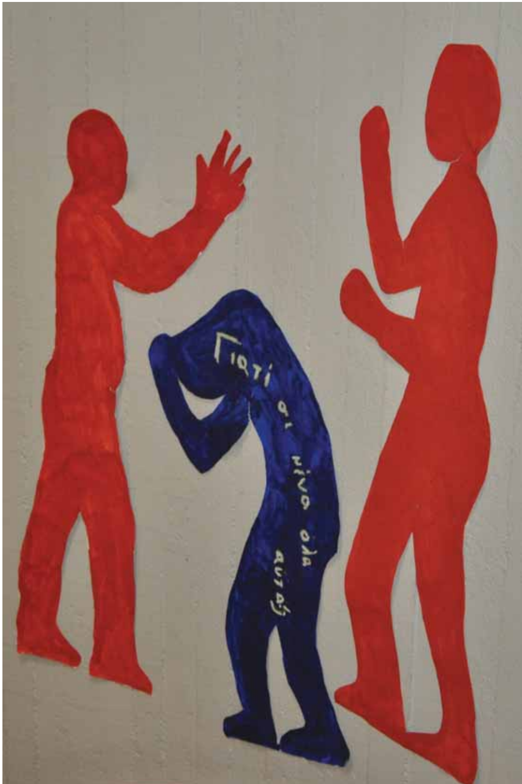
Ομαδική εργασία από το Εργαστήρι Ελεύθερων Δράσεων