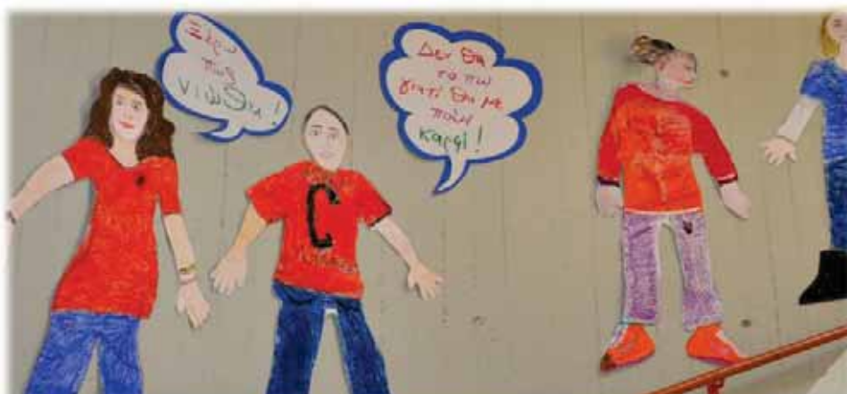
Ομαδική εργασία από το Εργαστήρι Ελεύθερων Δράσεων