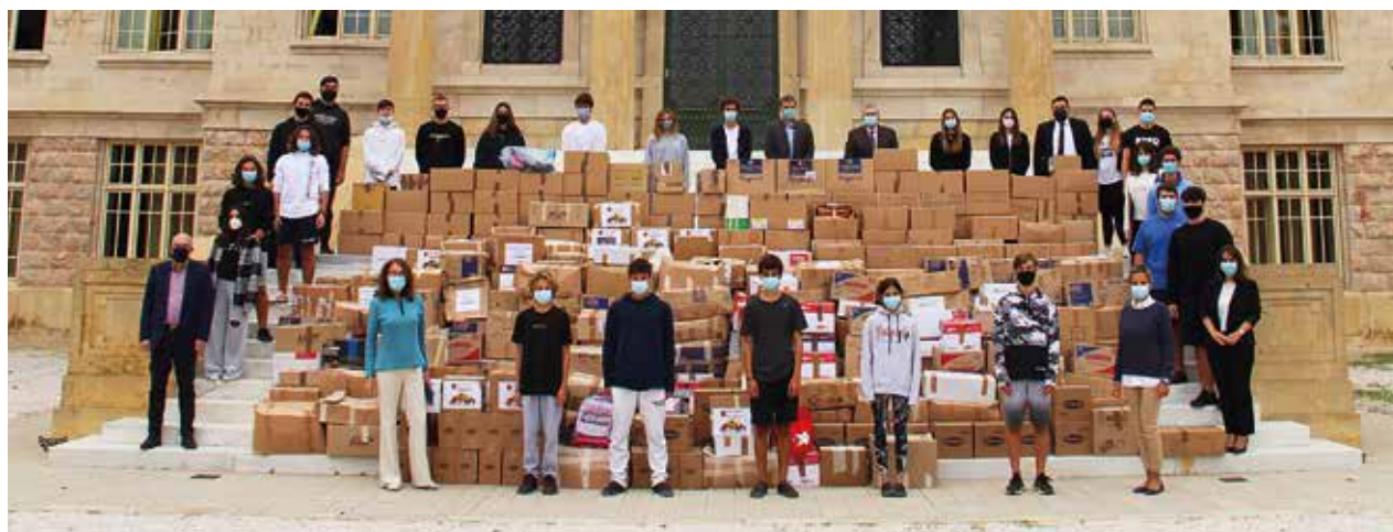
Οι Μαθητικές Κοινότητες του Κολλεγίου συγκέντρωσαν είδη πρώτης ανάγκης για τους κατοίκους Φαρσάλων και Μουζακίου.