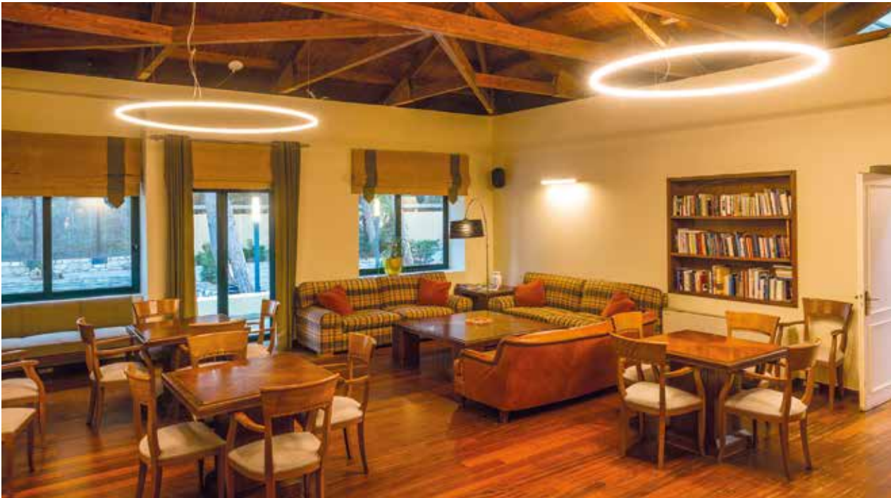
Η Κεντρική αίθουσα της ανακαινισμένης Λέσχης του ΣΑΚΑ

πρωτοβουλία –σε συνεργασία με την Εφορεία Αρχαιοτήτων Πειραιώς και Νήσων– για την συντήρηση και προστασία ψηφιδωτού της αρχαίας συναγωγής του τέταρτου αιώνα μ.Χ., που βρίσκεται δίπλα στο Αρχαιολογικό Μουσείο της Αίγινας.